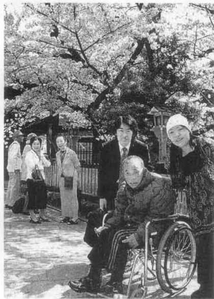
要介護者の旅行をサポートする旅のお手伝い業業